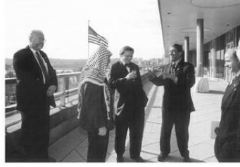
مع ياسر عرفات والمستشار التمساوي في وزعة الخارجية الأمريكية بفرقة مكتب وزيرة العلاجية مادلين أولبرايت