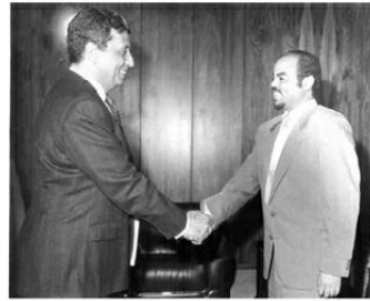
مع رئيس الوزراء الأثيوبي ملس زيناوي