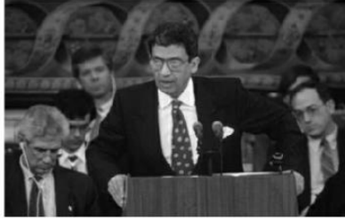
محدثاً أمام مؤتمر مدريد في ١٣ أكتوبر ١٩٩١