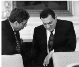
مع مبارك في البيت الأبيض قبيل الاجتماع مع الرئيس بيل كلينتون في إبريل ١٩٩٥