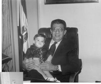
مع حفيدتي محمد مروان علي كومي وزير الخارجية قبل مغادرتي في مايو ٢٠٠١