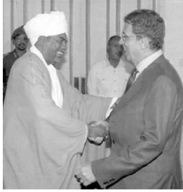
مع الرئيس السوداني عمر حسن البشير في الخرطوم