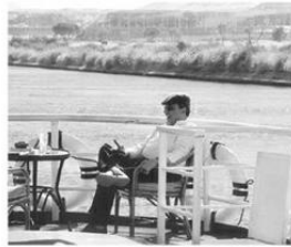
مستمتكا بإجازة في رحلة نابيلة بين القصر وأسوان