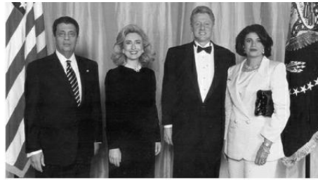
ليلي وأنا مع الرئيس الأمريكي بيل كلينتون وزوجته هيلاري