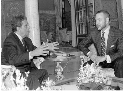
مع العامل المغربي الملك محمد السادس في الرباط