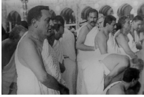
مع مبارك أثناء أداء مناسك الحج