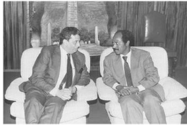
مع سيوم مسفن وزير خارجية أثيوبيا في أديس أبابا عام ١٩٩١