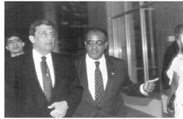
مع الأمين العام لمنظمة الوحدة الإفريقية سام أحمد سام في أديس أبابا