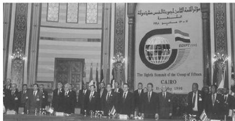
افتتاح اجتماع مجموعة الخمسة عشر الاقتصادية التابعة لحركة عدم الانحياز، مايو ١٩٩٨