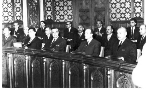
ضمن الوفد المصري المرافق للرئيس جمال عبد الناصر أثناء زيارته للهند يوم ٢١ أكتوبر ١٩٦٦، وفي الصورة يظهر عبد الحكيم عامر، أنور السادات، زكريا محي الدين، حسين الشافعي، صلاح نصر