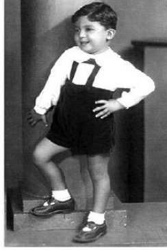
وأنا في الثالث من عمري