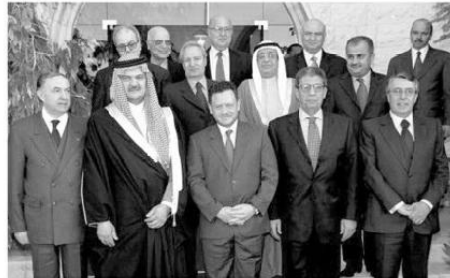
صورة تذكارية مع العامل الأردني الملك عبد الله بن الحسين وسعود الفيصل وزير الخارجية السعودية، ووزراء خارجية المغرب، الأردن، البحرين، سوريا، فلسطين، والأمين العام للجامعة العربية عصمت عبد المجيد في قمة عمان ٢٠٠٦