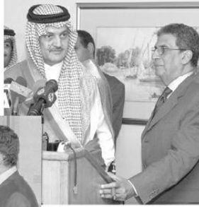
مع السيد سعود الفيصل في وزارة الخارجية بالقاهرة