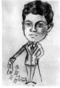
رسم كاريكاتيري رسم لي في المرحلة الثانوية يشير إلى حبي لمزب الورد