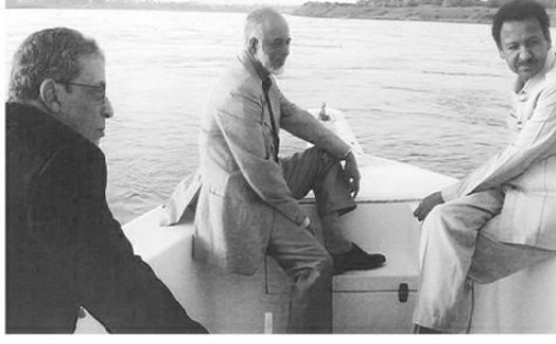
مع وزير خارجية سلطنة عمان، يوسف، بن عاوي في خيافة محبكتن عثمان إسماعيل وزير الخارجية السودانية عام ٢٠٠٠ على سفينة النهرين الأبيض والأزرق