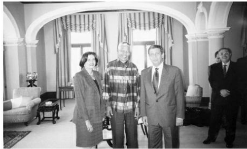
أنا ويلي مع الزعيم التاريخي نيلسون مانديلا في زيارتي لجنوب إفريقيا سنة ١٩٩٤