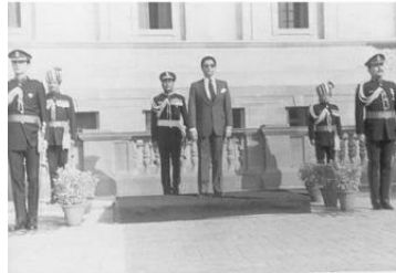
مستعداً لاستعراض حرس الشرف ضمن مراسم اعتمادي سفيراً بالهند