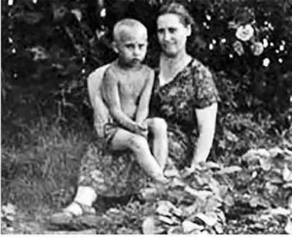
بوتين مع والدته ماريا في يوليو 1958 عندما كان عمره خمس سنوات.

في سبتمبر 1960، بدأ بوتين الدراسة في المدرسة رقم 193 في مدينة لينينغراد التي لم تكن تبعد كثيرًا عن المكان الذي ترعرع فيه في باسكو لين، كان عمره ثماني سنوات تقريبًا؛ لأن أمه أخرت التحاقه بالمدرسة.