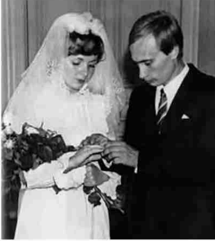
في 28 يوليو 1983، وبعد مدة خطوبة طويلة، تزوج بوتين وليودميلا شكربينييفا التي كانت تعمل مذيعة في شركة طيران إيه اف و كانت تعيش في كاليفورنيا.