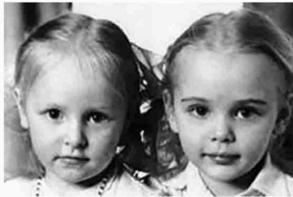
ولدت ابنة بوتين الثانية؛ كاترينا (إلى اليسار) في دريسدين في العام 1986.