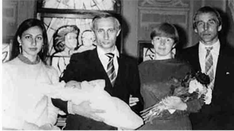
ولدت طفلة بوتين الأولى؛ ماريا، في موسكو في العام 1985. يظهر بوتين وليودميلا مع صديقيهما سيرجي وايرينا رولدوغن.