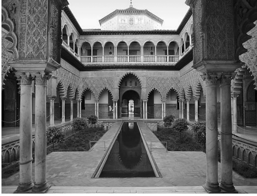
بهو للعدارى بقصر إشبيلية.

بُنِيَ هذا القصر، أو ما كان مكانه من قصر وحصن للسلطان الموحيدي أبي يعقوب يوسف (١١٨٤) فتهدّم في الحروب، وأعاد بناءه أيام الملك بطرس العاتي في القرن الرابع عشر، مهندسون وعمّال من المغاربة المنتصرين Morescos.