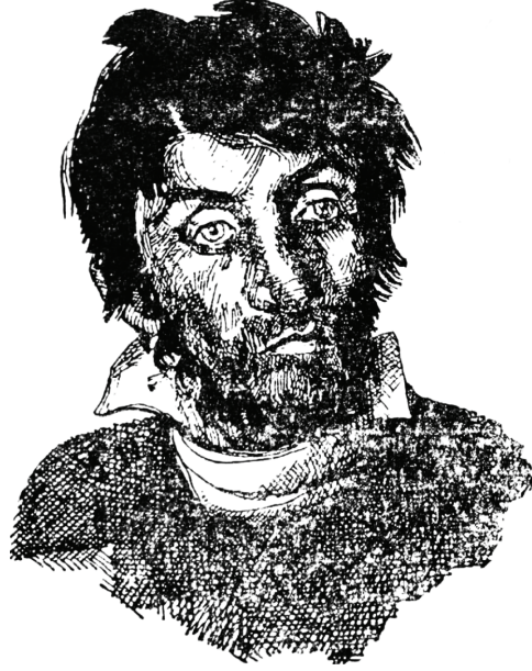
شيلوك تاجر البنديقية.

يكيّل الاتهامات للآخر، وعليك في النهاية أن تختار حزباً من أحزاب أيّ مخابرات تشاء، وتنتهم به غيرك أو يتهمك غيرك به.