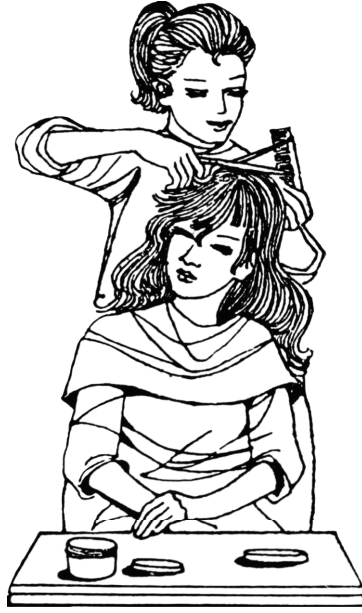
فتاة تعمل كوافيرة.

الهدف الحياة، والإرادة وسيلة التحقيق، والخطوة المنطقية التالية هي تحديد مسلك الإرادة، أو معنى أبسط: الخطة. لا حياة إلا بخطة، ولا طريق للوصول لأتفه الأهداف إلا بخطة؛ لهذا فقد رُوِّعني حقاً أن الأمور لا تجري في هذا الجزء من العالم اعتباطاً، ليس على مستوى الأمم إنما حتى على مستوى الأفراد. بل إن التخطيط للآن هناك ينبع أصلاً من جنوح الفرد للتخطيط لحياته.