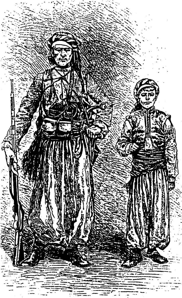
مهنا وابن أخيه - رسم ل ا فردينا نديس نقلأ عن صورة للمؤلف 1878م