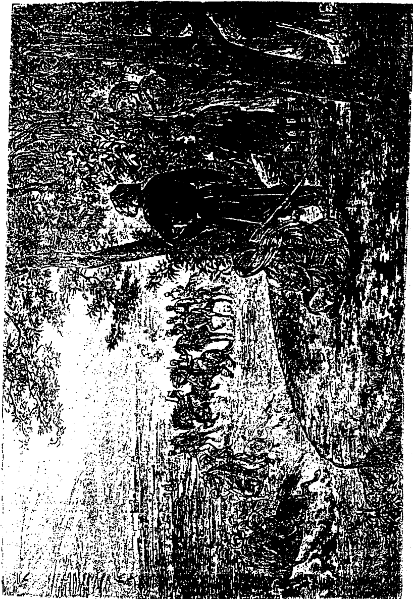
الخريد - رسم ل فرديناندي بوجي من التصن وإشارات المؤلف 1878م