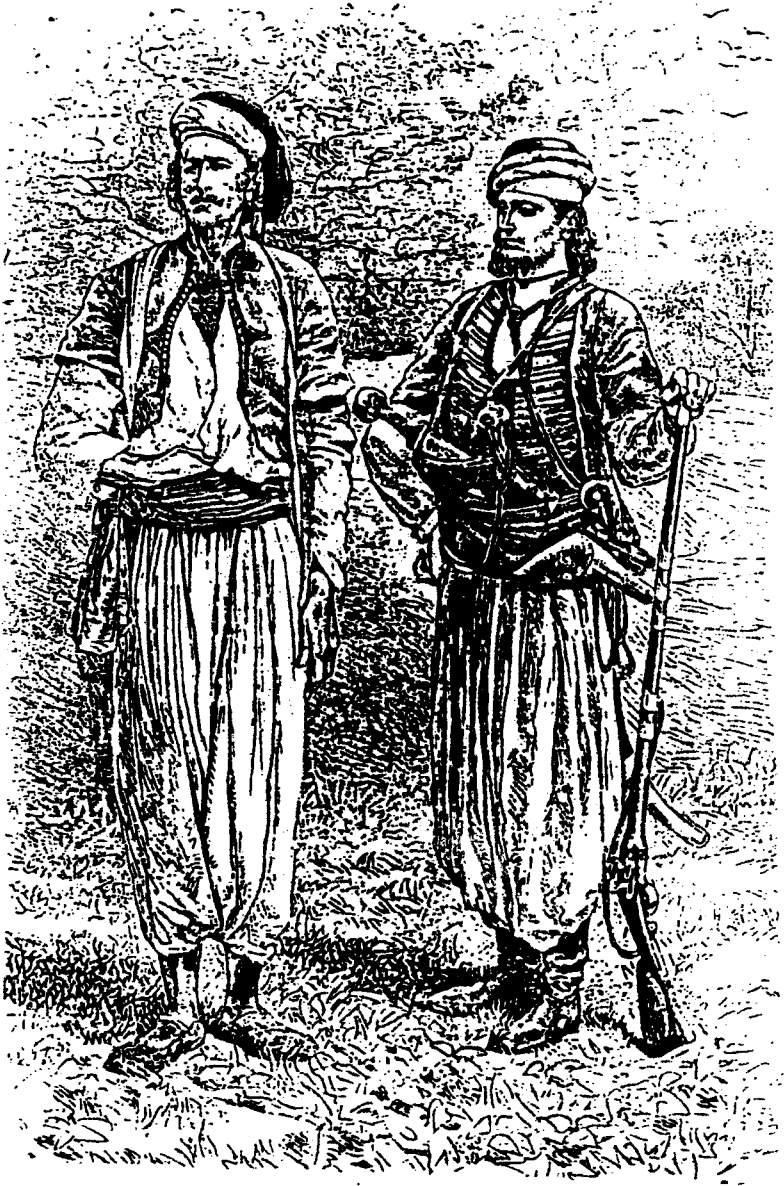
حامد وحسان اغيس رسم ل ا فردينا نديس نقلأ عن رسم للمؤلف 1878م