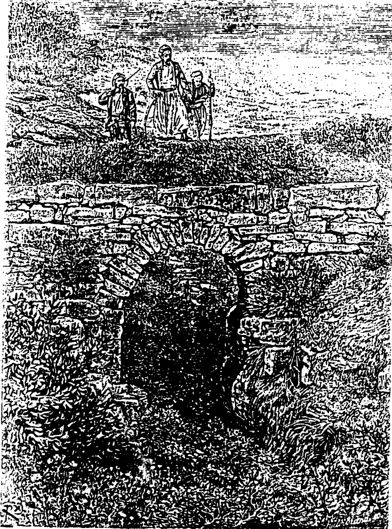
جسر الشحادة - رسم ل ف ريجامي نقلا عن المؤلف 1878م