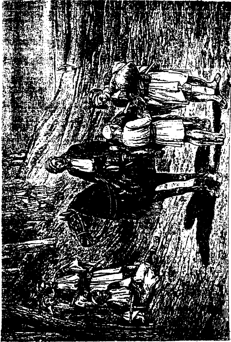
الكهنة - رسم لـ فـ ريجاندي بوهي من التصوير وصور الفوتوغرافية 1878م