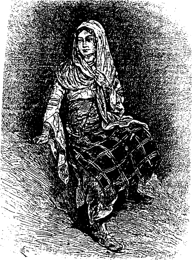
امراة من قليليني - رسم ل ف ريجامي نقلاً عن رسم للمؤلف 1878م