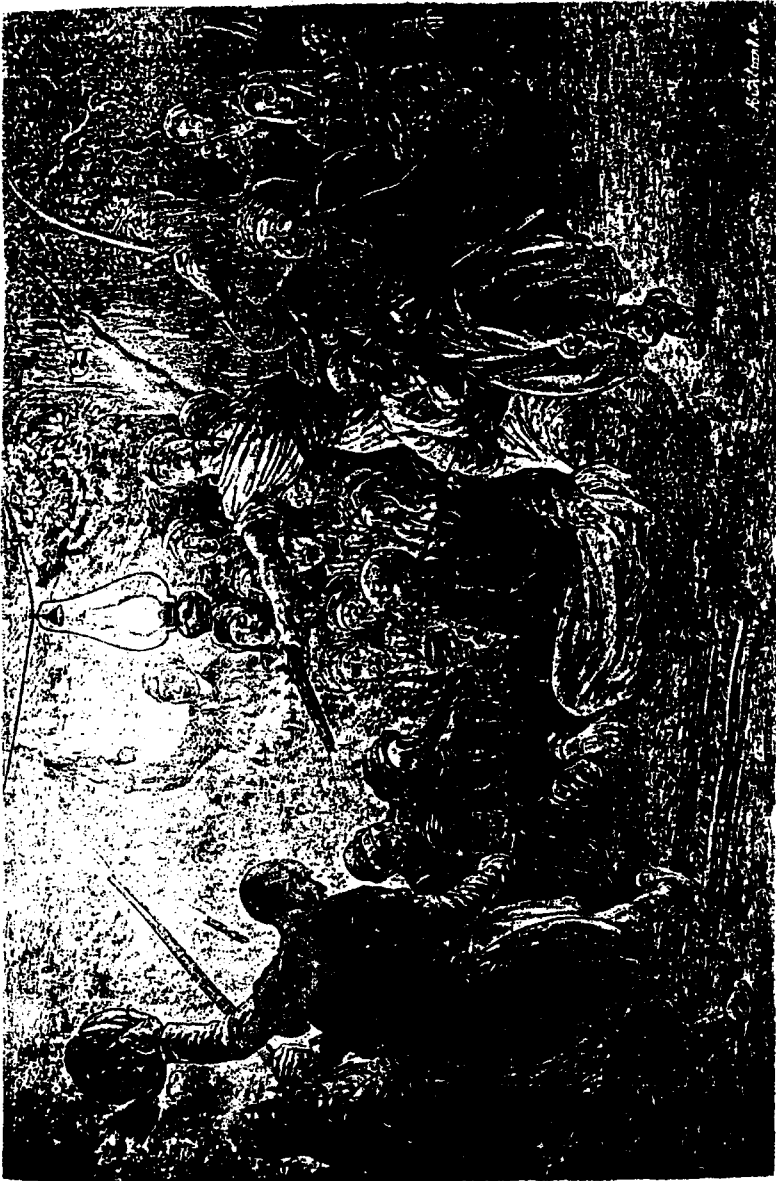
عبد في رحاب العلويين - رسم ل ف رينجامي بوجي عن نص ومخطوطات للمؤلف م 1878