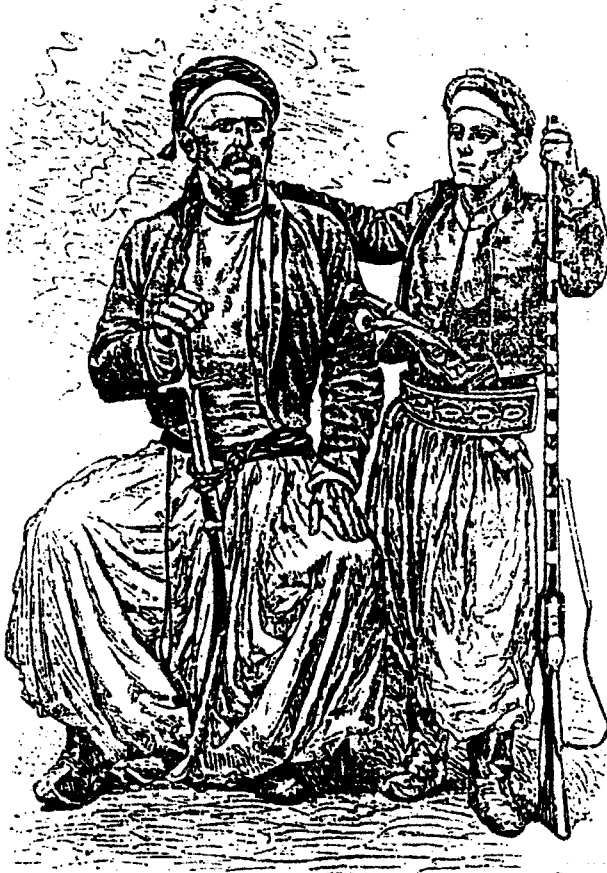
كنجو وابنه - رسم ل أ فردينا نديس نقلأ عن صورة للمؤلف 1878م