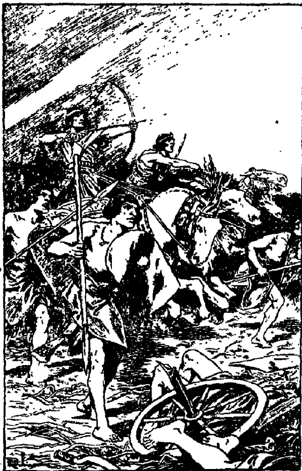
هجوم المصريين نحو المدينة