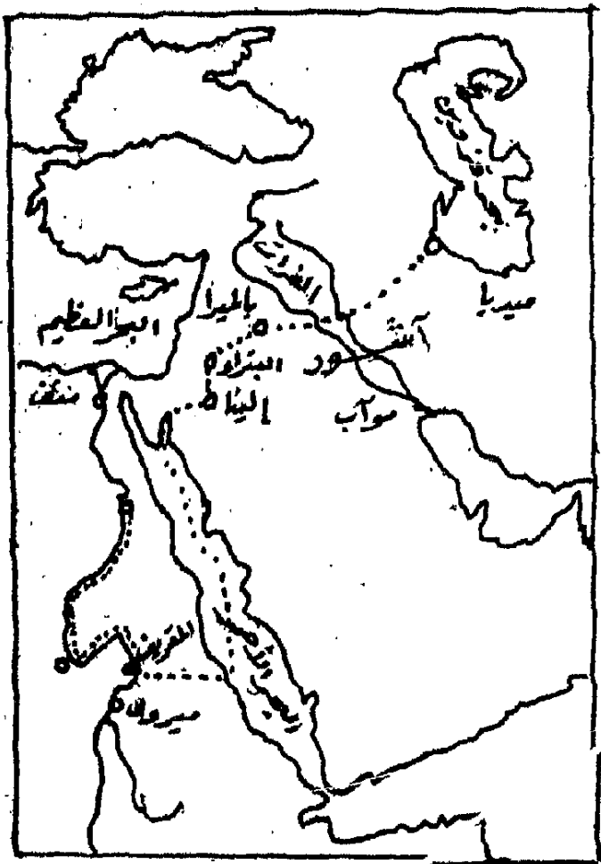
خط سير الرحلة