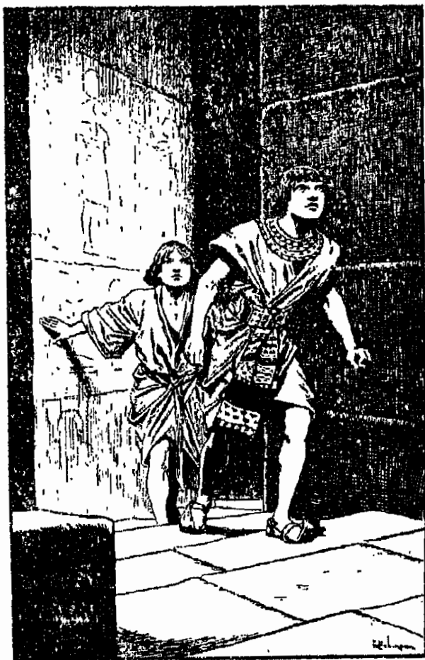
تحسبا لطريقها يحذر عبر الدرجات المظلمة