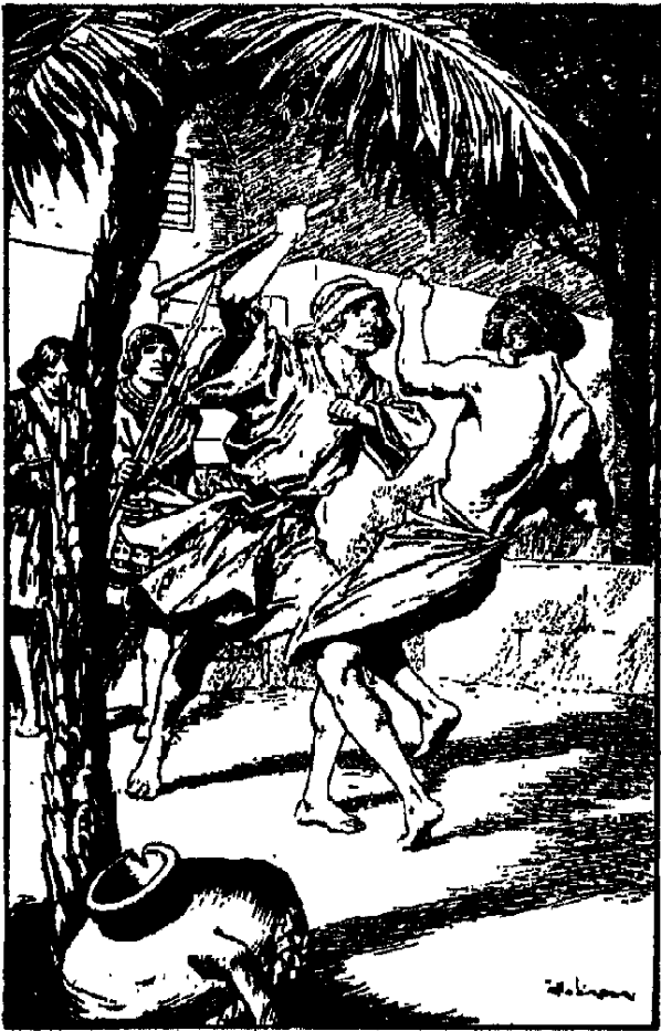
وانهال جيثرو بالهراوة على رأسه