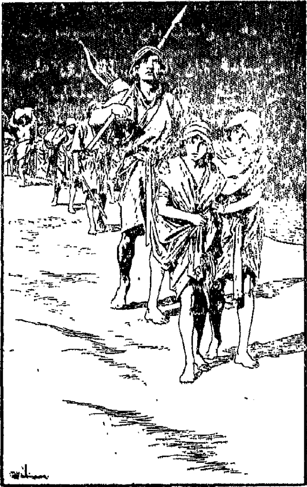
ثالث روث لمايسة : لابد إن نحمّل الصعاب