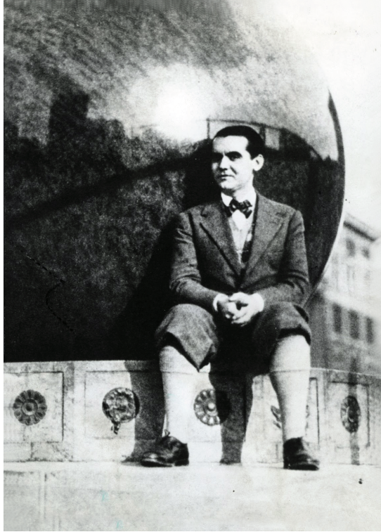
لوركا في حرم جامعة كولومبيا بنيويورك.