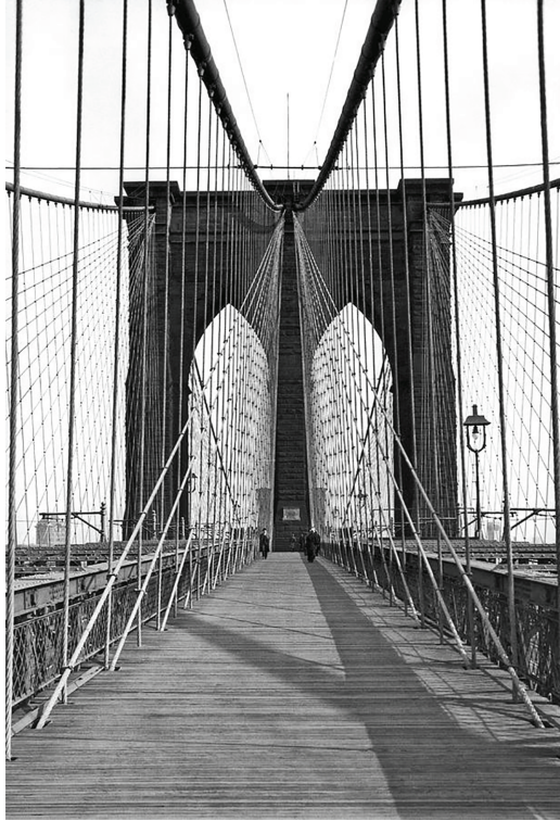
ممر المشاة على جسر بروكلين.

إذا نما الفطر كثيفاً على صدغي امرئ ما، فلتفتحوا الباب الأرضي، لكي يرى تحت شعاع القمر، الأكواب الزائفة، والسم، وجمجمة المسارح.