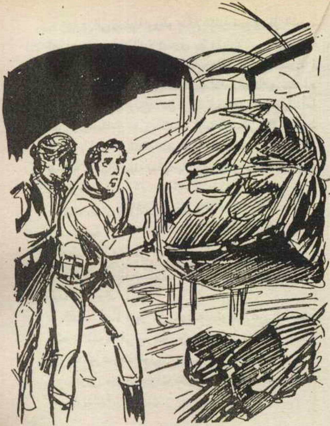
فارتفعت تلك الكتلة عن الأرض في هدوء ، وكأنها تسبح في الفراغ ..