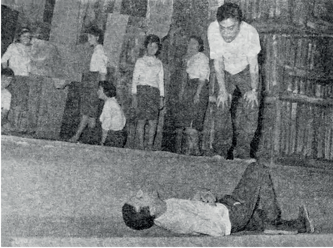
فرفور في حالة إضراب بينما السيد يهدده.

صوت زوجة السيد: يا حبيبي النهاردة خمسة في الشهر (بصوت مؤدب من خلف الستار) وما ادتنيش المصاريف، إنت موش عارف إن الشهر ده عندنا كمان فلوس الخياطة، اعمل حسابك، أنا حابتي أزل أهو، وإذا ما جببتش الفلوس بكرة، ما أقدرش أقولك بقى أنا حاعمل إيه.