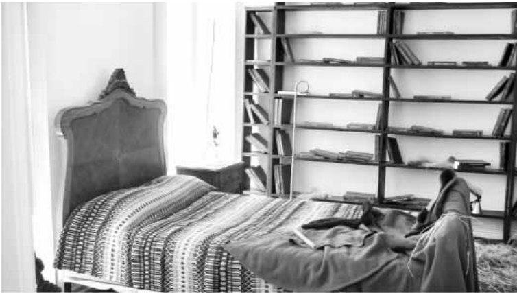
غرفته كما تركها