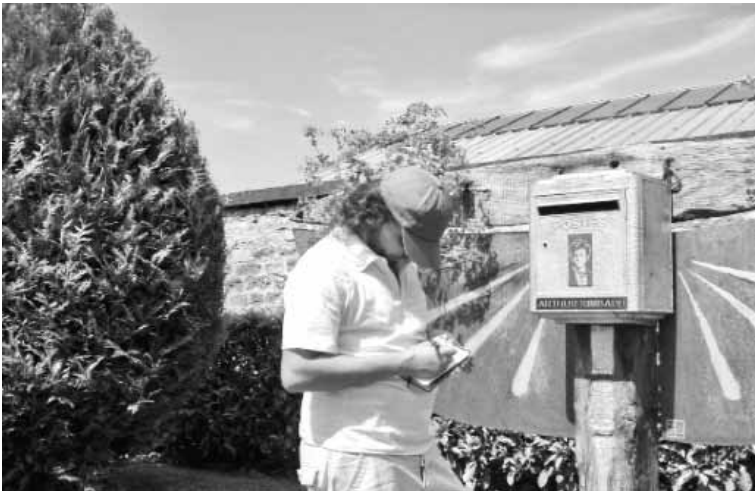
صندوق بريده في المقبرة