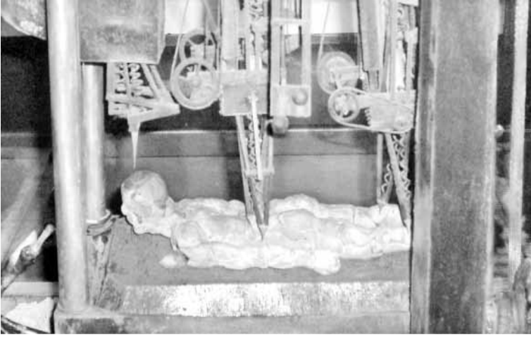
آلة التعذيب في متحفه