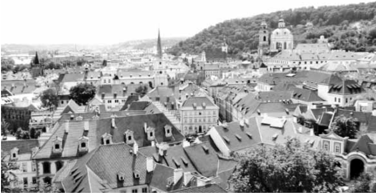
براغ من القلعة