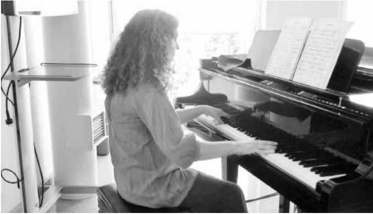
عازفة البيانو في بيته