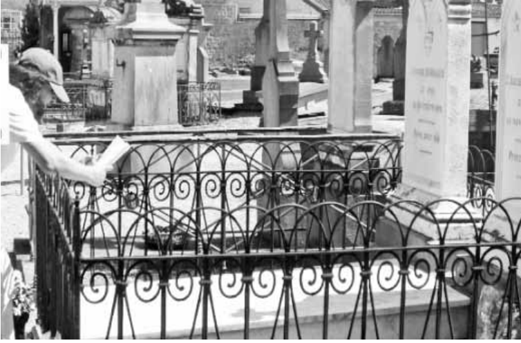
أقرأ ما تيسر من رياض على قبره