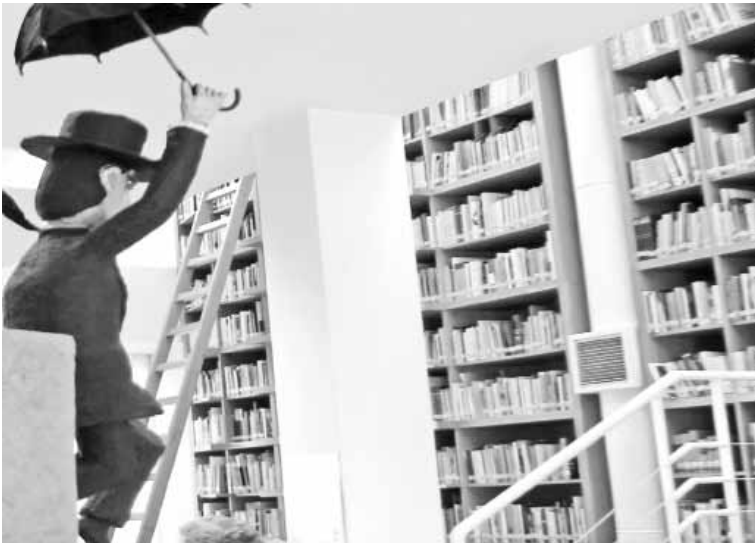
في بيته الذي أضحي متحفًا