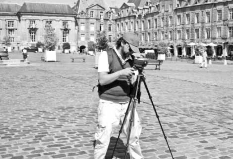
في ساحة البلدة