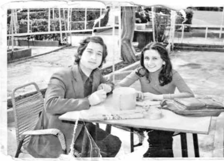
ابتسامته مع سمر (س)