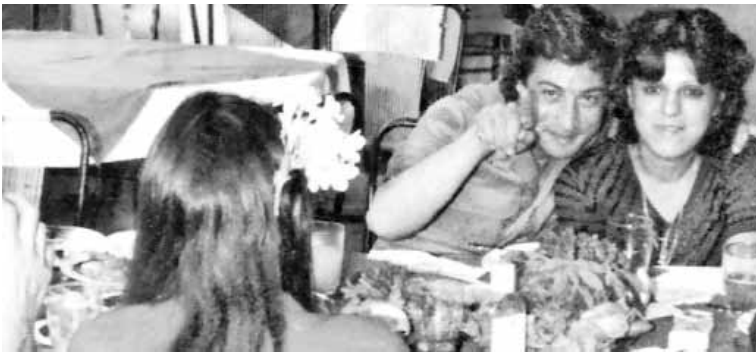
في حضرة أصدقائه