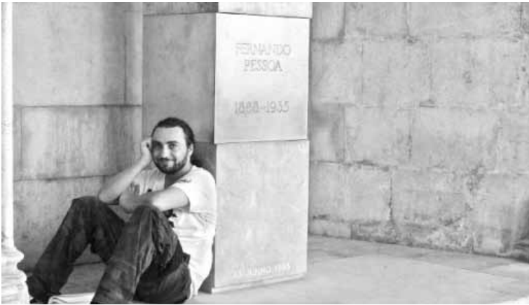
بعد القراءة مرتكياً على القبر