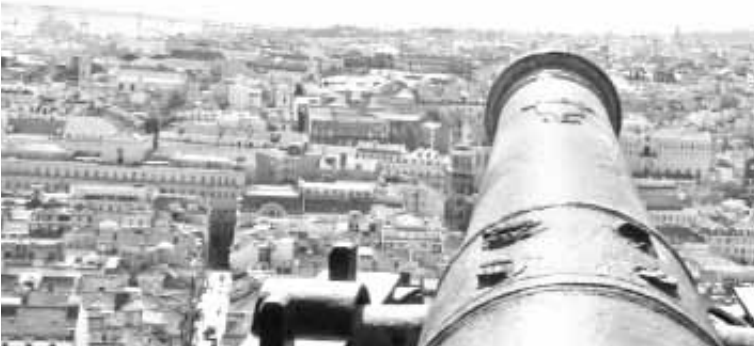
من القلعة إلى المدينة