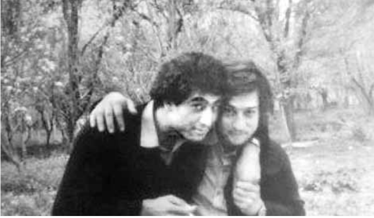
في غوطة دمشق نيسان 1982 سنة وفاته