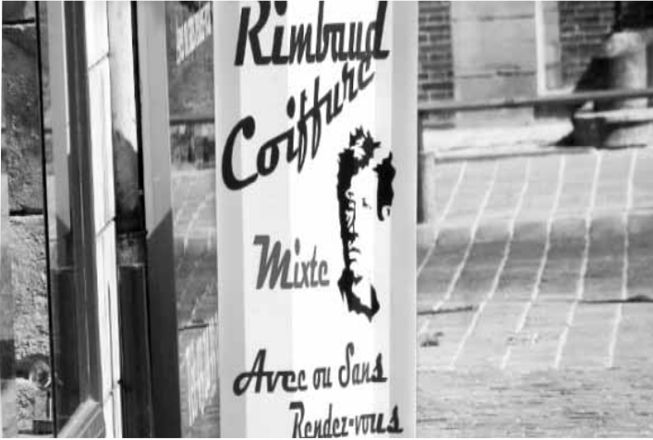
محل حلاقة باسمه