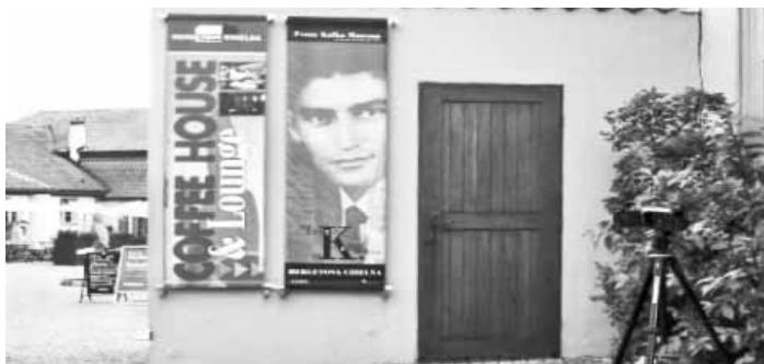
كاميرتي على مدخل المتحف