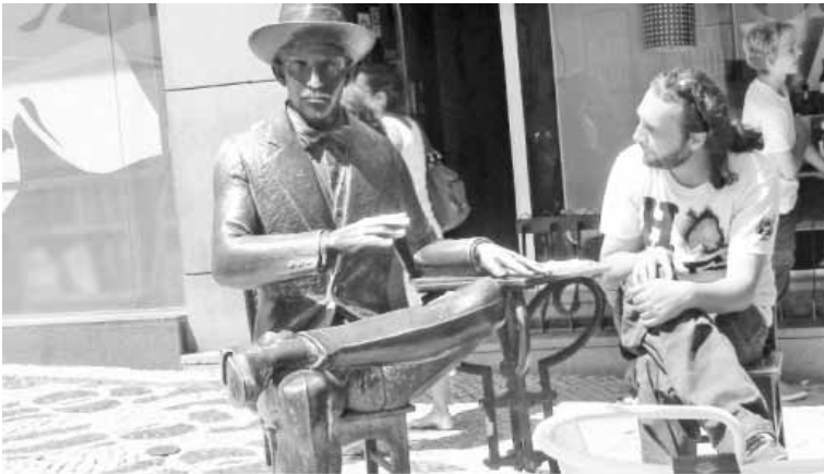
محاولة للحديث مع بيسوا في مقهاه