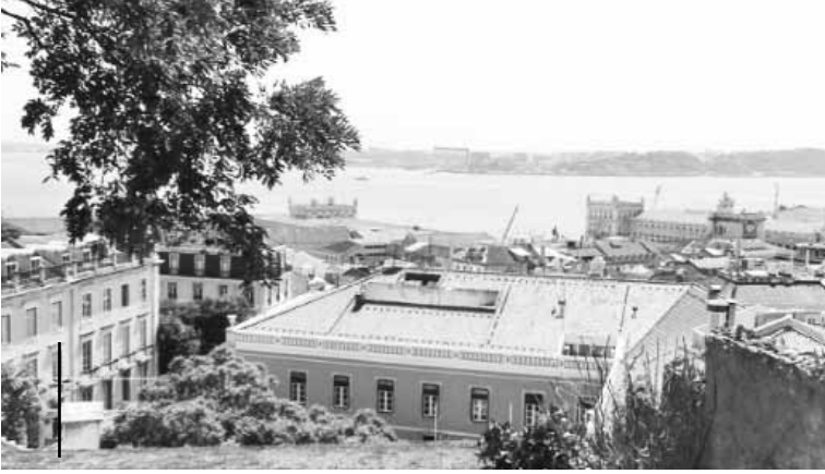
بعض من لشبونة