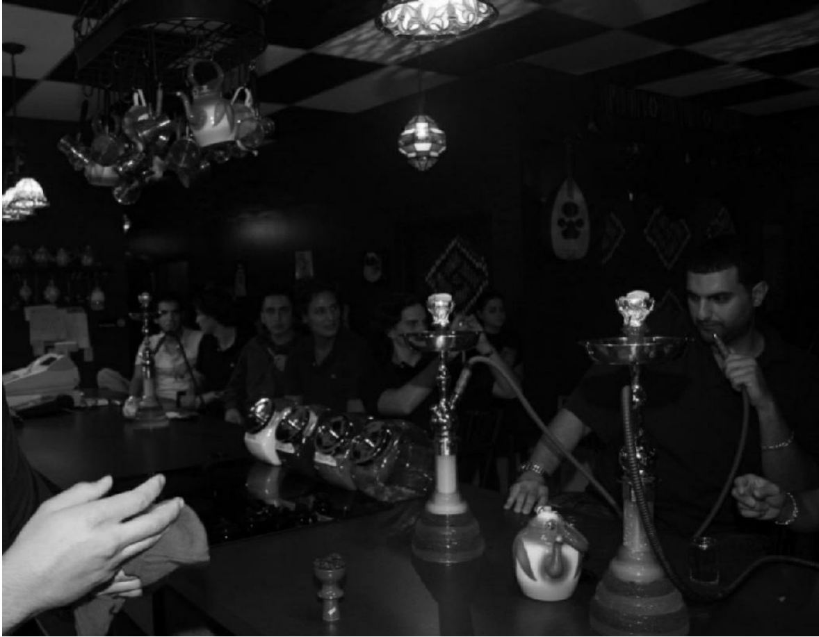
جانب من الزبائن في إحدى كافيه شيشا 2006